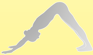
Yoga nach Iyengar

Fit im Frühjahr - Gesund durch den Sommer Kurs-Programm 1. Halbjahr 2024