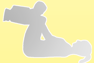
fitdankbaby® MINI / MAXI