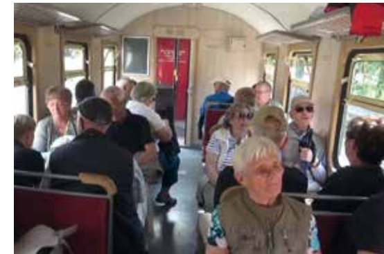
Beschauliche Fahrt zum Brocken

Wir stiegen in den Zug ein und genossen die Fahrt zum Brocken. Wir fuhren gegen 9:30 Uhr ab, Ankunft auf dem Brocken um 10:25 Uhr.