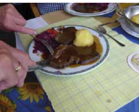
Abschluss bei Wildbraten

Auch ich sage im Namen der Sportabzeichengruppe „Danke“ an alle, die bisher diese Fahrten ermöglichten.