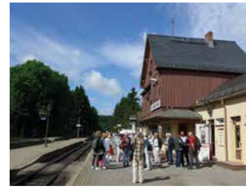
Abfahrt am Bahnhof Drei Annen Hohne