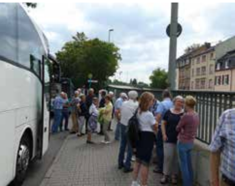
Buseinstieg in Hedderheim