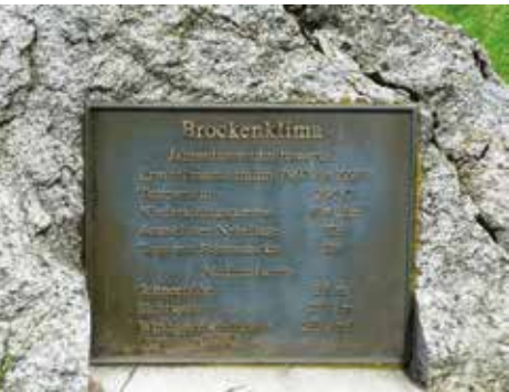
Auf dem Brocken

Man hat uns bis 12:00 Uhr Zeit gelassen. Jeder hatte genug Zeit den Brocken-Gipfel zu erkunden. Wir hatten herrliches Wetter und von dort oben eine Fernsicht, wie man sie nur an wenigen Tagen im Jahr geboten bekommt.