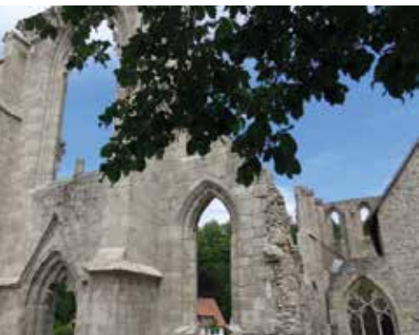
Reste des Doms in Walkenried