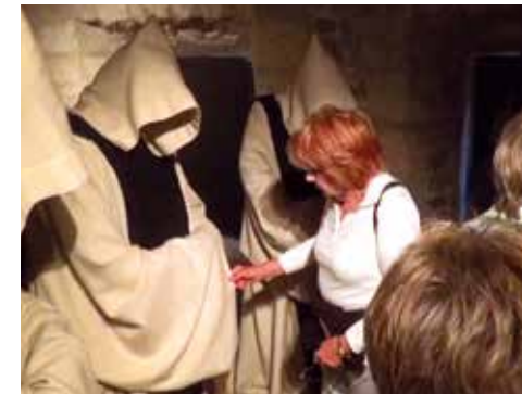
Im Museum der Ruine