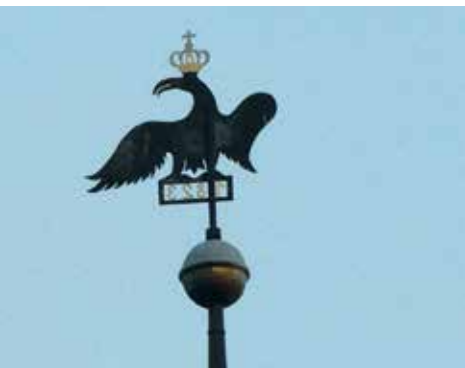
Wetterfahne in Bad Sachsa