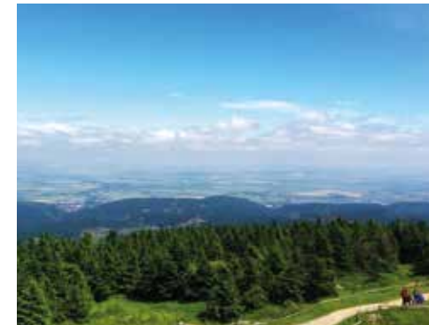
Auf dem Brocken