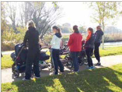
Die Fotos wurden in der letzten Kursrunde „Mami Workout mit Baby“ aufgenommen.

Egal ob Einsteigerin oder sportlich Aktive - jeder ist willkommen.