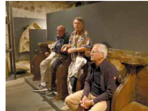
Im Museum der Ruine

Bis zum Mittagessen hatten wir noch Zeit und unsere Reiseleitung hatte für den Vormittag noch etwas vorbereitet. Unser Bus stand zu einer Besichtigungsfahrt bereit. Die Koffer konnten wir in unserem Zimmer lassen. Das Wetter war nicht so schön wie am Vortag aber das störte uns wenig. Das Ziel war der Ravensberg. Er ist 650 Meter hoch und ermöglicht einen herrlichen Rundblick.