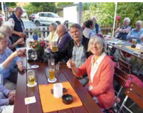
Grillbuffet im Biergarten

Es war wieder soweit, schon im vergangenen Jahr, im Sommer 2016, verkündete uns Horst Depner, dass es diesmal eine Fahrt in den Harz geben wird. Leider konnte er durch seinen Tod diese Fahrt nicht mehr selber durchführen. Am 23. Juni 2017 stand unser Bus zur Abfahrt pünktlich um 9:00 Uhr am Busbahnhof in Hedderheim bereit und setzte sich auch fast pünktlich in Bewegung.