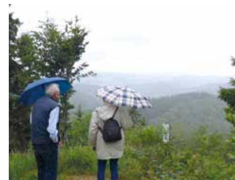
Blick vom Ravensberg