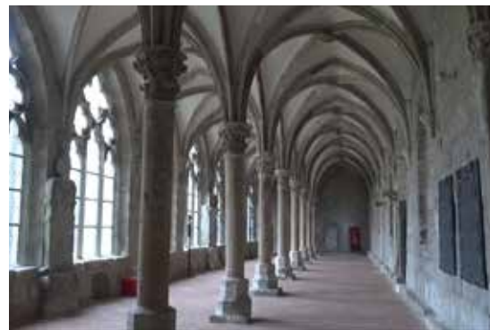
Im Museum der Ruine

Dort wurde uns erklärt, dass wir uns in einem Kloster befinden, das fast vollständig erhalten ist und von außen nicht als solches zu erkennen ist. Walkenried war ein Zisterzienser-Kloster, das sich selbst verwaltete. Die Bauernhöfe, die man heute noch erkennt, gehörten zum Kloster und wurden von dort auch von den Mönchen bewirtschaftet. Das Kloster war also Selbstversorger und verkaufte seine Überschüsse auf einem Markt. Walkenried war gegenüber den Nachbargemeinden wohlhabend.