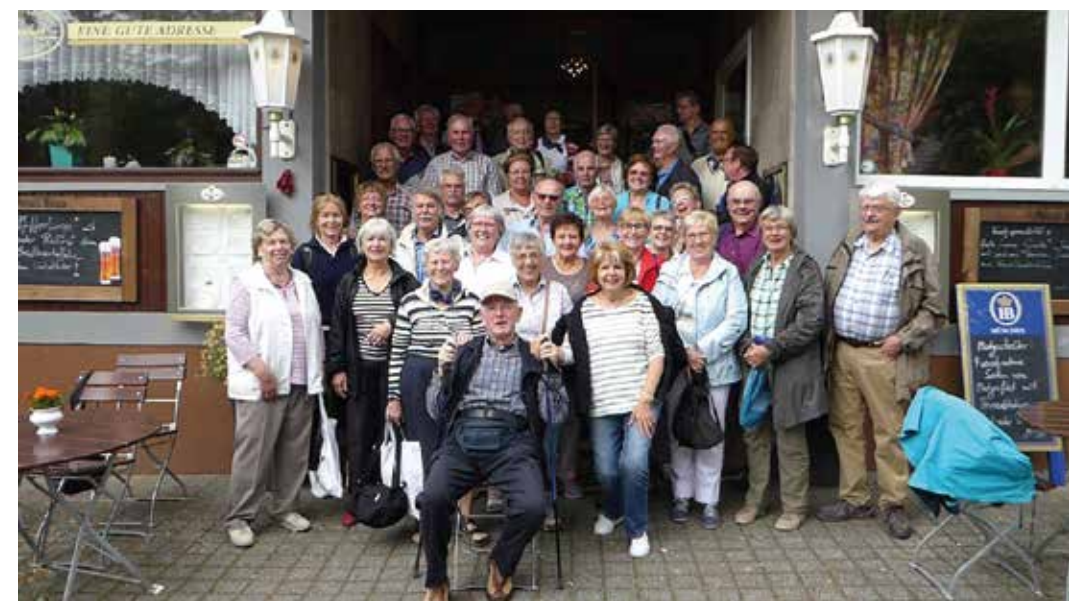
Die gesamte Reisegruppe Harz 2017